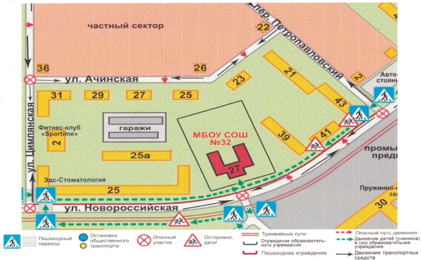
Схема организации дорожного движения в непосредственной близости от образовательного учреждения с размещением соответствующих технических средств, маршруты движения детей и расположение парковочных мест